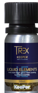
リキッドエレメント