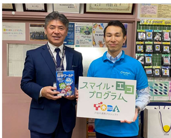
埼玉県戸田市 戸田第二小学校