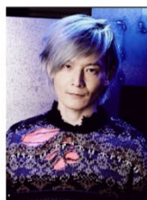
慶應義塾大学 医学部教授 宮田裕章 代表理事