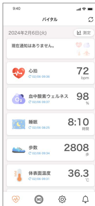
スマートフォンアプリ画面例