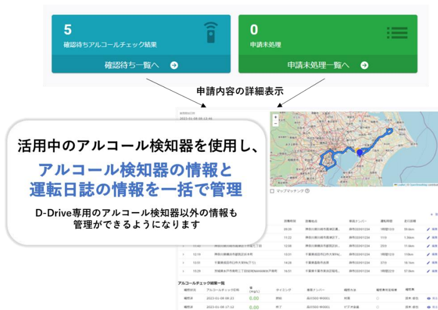
図1 運転日誌・アルコールチェック結果の管理画面イメージ

(1) 通勤など業務時間外の走行記録を区分して保存、(2) 点呼委託業者の使用、(3) 週報・月報に総走行距離、総運転距離の表示、が可能となります。