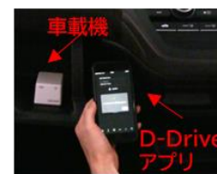
↑エンジンロックを解除