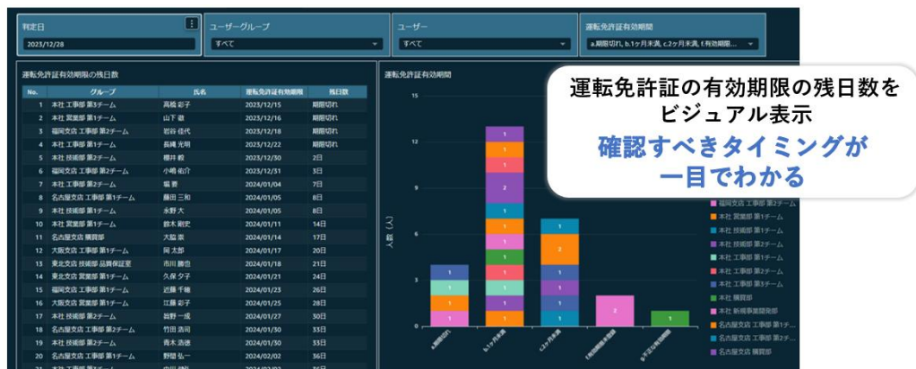
図3 免許証の有効期限の管理画面イメージ

運転免許証有効期限切れが起きないように、免許証の有効期限が管理できます。日々の運転者管理の効率化に役立ちます。