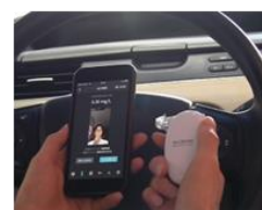
↑運転者のアルコールチェック