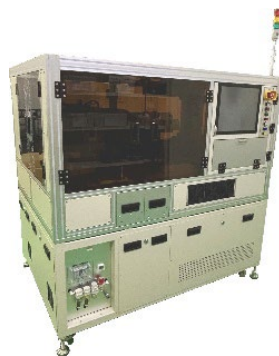
新型オートハンドラ

具体的には、現在実施している ROM 書込み能力の増強を目的とした MAT の本社建て替えおよび大規模な設備投資において、新社屋に設置する空調設備や受電設備内の変圧器に省エネタイプを導入するほか、従来の装置に比べて稼働時の消費電力を削減できる新型オートハンドラの導入を進めています。今回はこれらの取り組みが評価され、MAT の設備投資に対する融資が SII の省エネルギー設備投資利子補給金案件に採択されました。昨年11月に実行された本設備投資に係る三菱 UFJ 銀行および三井住友銀行からの長期借入金合計 989 百万円に対して、今後利子補給を受けることとなります。