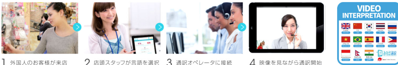
1. 外国人のお客様が来店 2. 店頭スタッフが言語を選択 3. 通訳オペレーターに接続 4. 映像を見ながら通訳開始

また、通訳コールセンターは、英・中・韓・タイ・ロシア・ポルトガル・スペイン・ベトナム・フランス・タガログ・インドネシア・ネパール・ヒンディーの13言語で24時間365日対応(※一部言語を除く)しております。