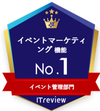
ITreview イベント管理 カテゴリーレポート 2024 Winter