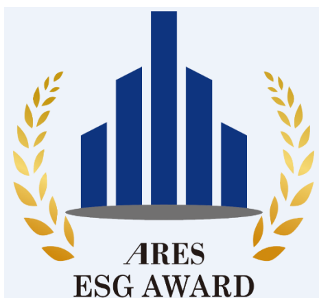
ARES ESG アワード 公式ロゴ