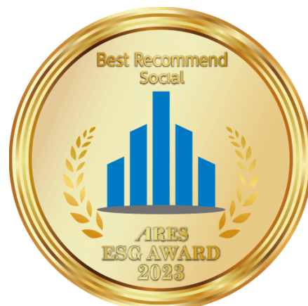
ARES ESG AWARD 2023 ベストレコメンド賞 表彰ロゴ