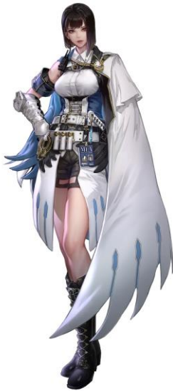
西島 佐理/Nishijima Sari (CV: 鬼頭 明里)

「誰にも負けない最強の魔法使い」になることで、 自分を抑圧から解放し自由を手に入れるために、 父が残した言葉をたよりに渋谷を訪れる。