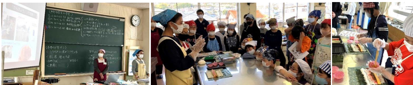
過去の巻寿司教室の様子

広島市立 井口明神小学校（〒733-0841 広島市西区井口明神1丁目13-1） ※6年生（2クラス）を対象