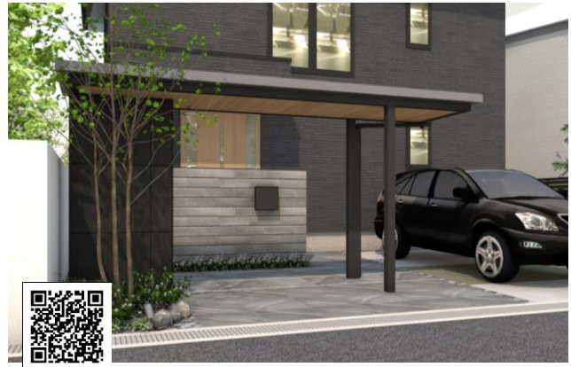
【トライゲートルーフ】