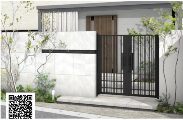
【ロートアルミゲート】

※『パッケージプランサイト デザイナーズサイト』 https://proex.takasho.jp/pac-designer/