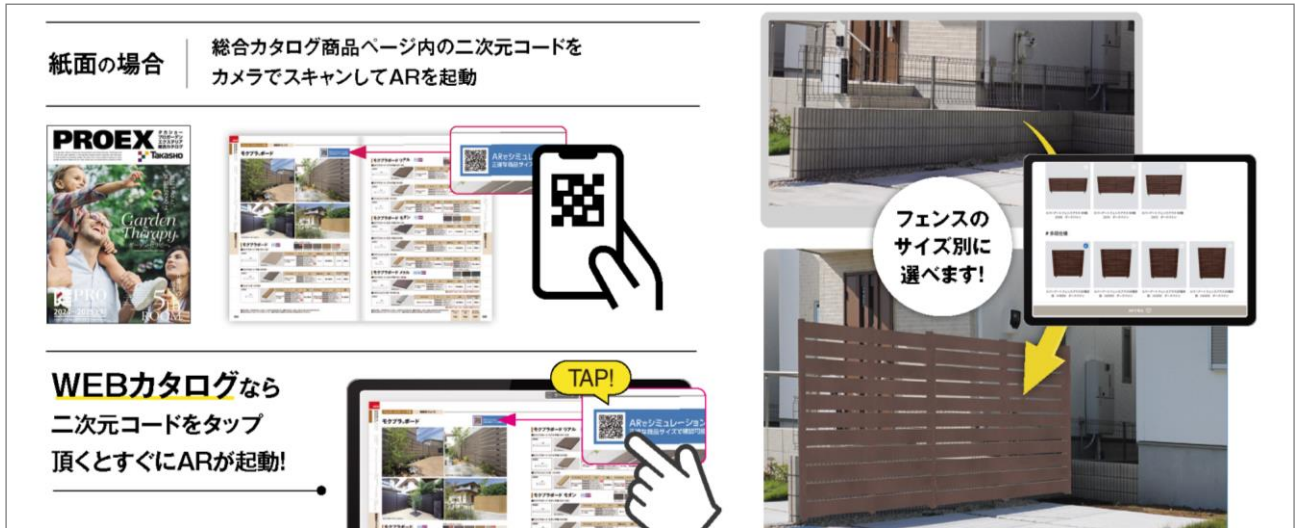
【WEB AR 機能 イメージ】

また、各種 WEB コンテンツにアクセス可能な二次元コードも多数配置。加えてカタログだけでは表現しきれない商品情報を一覧で閲覧できる「データバンクシステム」を 2024 年 3 月より本格稼働。カタログを軸に、さまざまな情報を簡単にアクセス可能な DX ツールとして活用いただけます。