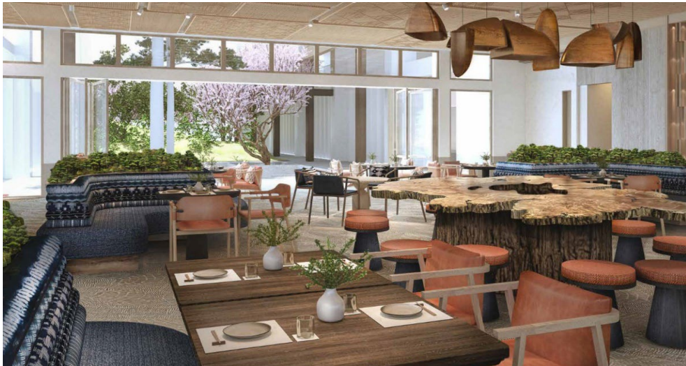
オールデイダイニング