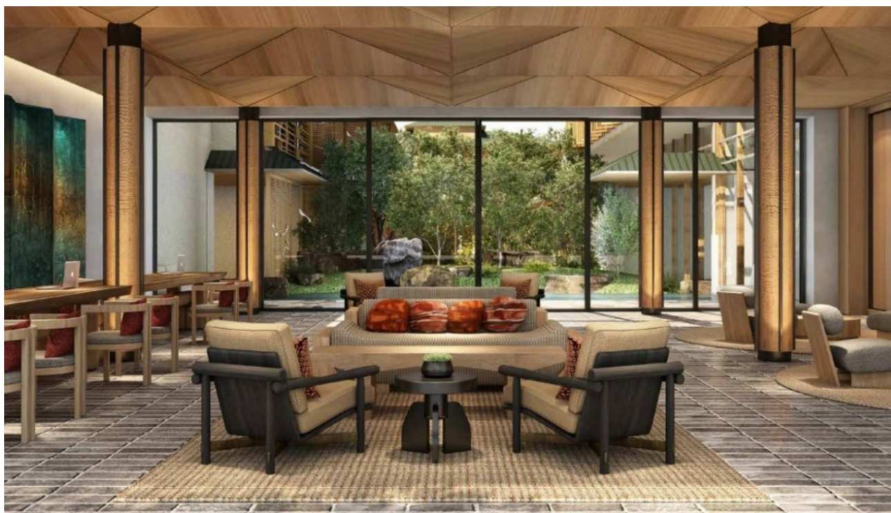
1階ロビー・レセプション