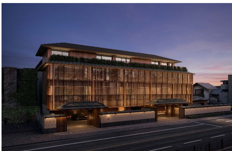
外観イメージ（パース）

シックスセンスブランドとして日本初上陸のホテルとなる「シックスセンス 京都」は、本ブランドが掲げる最先端のウェルネス&スパ、斬新なレストランコンセプト、地域の隠れた魅力に触れる散策など、非日常的な体験を提供します。