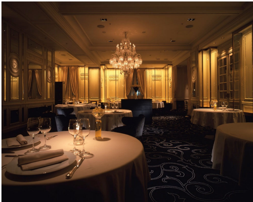
Chateau Restaurant Joel Robuchon 東京都目黒区三田1-13-1 恵比寿ガーデンプレイス内