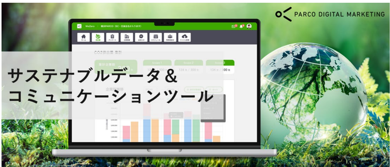
図1 サステナブルデータ&コミュニケーションツール『エコテックサービス』

この潮流はビートレンドがこれまで販促面で支援してきた流通・飲食・サービス業などの企業も例外ではありません。この度新たにリリースする『エコテックサービス』が、『betrend』利用企業をはじめとする流通・飲食・サービス業のサステナブル施策実施の助けとなり、さらには販促活動を含む企業活動の最適化に貢献できればと考えております。ビートレンドでは今後も、流通・飲食・サービス業の企業発展に貢献できるサービスを提供してまいります。