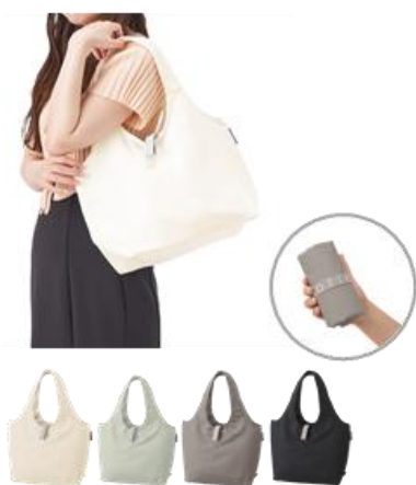
ミニマルシェバッグ