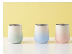
グラデーションサーモ タンブラー