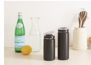
炭酸サーモボトル