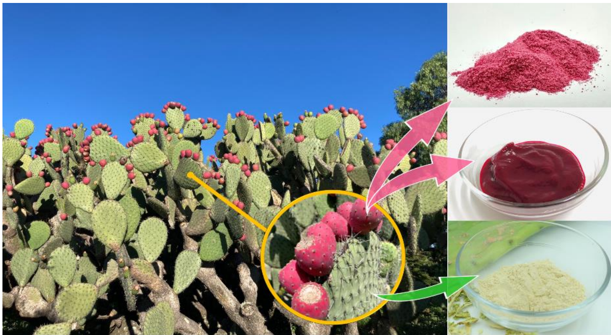
メキシコで育つウチワサポテン / 綿半トレーディングのウチワサポテン製品