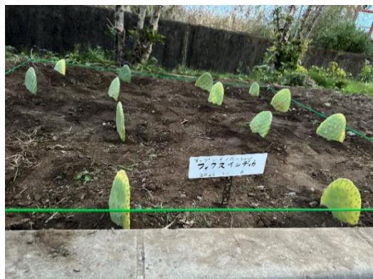
オープンイノベーションで植えたサボテン