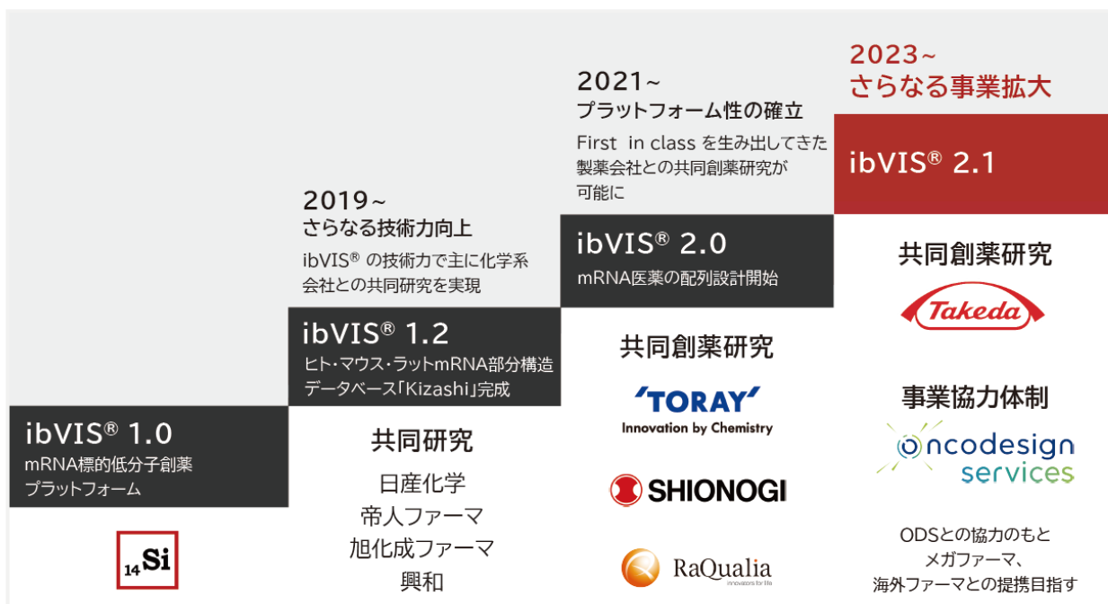
図1. プラットフォーム型ビジネスを活用した技術力向上と事業拡大

現時点において、当社は自社パイプラインを保有しておりません。当社は、多額の開発費を投入して少数の自社パイプラインを育てる代わりに、共同創薬研究のパートナー数を増やすとともに、各パートナーとのプロジェクトを進捗させることで、相乗的な事業拡大を図っています。当社はこれまでに、プラットフォーム型ビジネスの特徴を生かしたパートナーとの共同研究を通じて ibVIS ® プラットフォームの技術力向上を達成し、より高収益の共同創薬研究契約の締結が可能になりました。この好循環を回すことで、武田薬品工業株式会社との提携を皮切りに、海外製薬会社を提携先として獲得することを目指し、さらなる事業拡大を目指します（図1）。