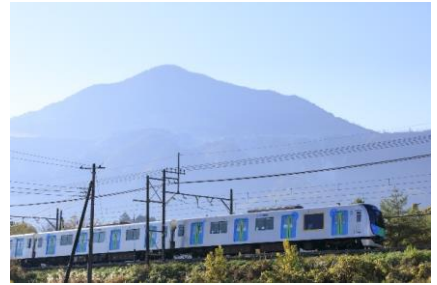
【S-T R A I Nご利用のイメージ】