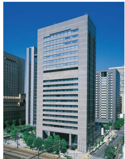
写真:ビジョンセンター新橋 左)室内イメージ 右)ビル外観

「ビジョンセンター新橋」は、JR「新橋駅」を含む3駅徒歩5分以内に位置し、2023年12月に開業したホテルとオフィス用途の複合ビル「内幸町平和ビル」の16～18階の3フロアで運営する貸会議室です。総床面積は約391坪(1,291㎡)で、8～450席の大小様々な会議室(全9室)を設け、多様化するお客様のニーズにお応えする機能とサービスを備えています。専任スタッフが常駐し、事前準備から当日の運営まで、細やかにワンストップでサポートいたします。企業研修やセミナー、会社説明会、試験会場、面接会場、懇親会パーティーなど、多様な用途にご利用いただけます。