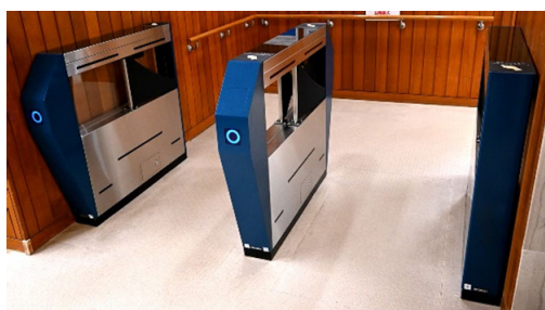
ゲート（温水プール・浴場の各出入口）