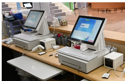
ポスレジ（受付、トレーニングルーム、ヘアカット、整体）

入館時に受付窓口よりICリストバンドを受取り、お客様はご利用施設に応じ後払い精算を行うシステムとなります。料金のご利用の施設に応じた変動型で、回数券やパスポートなどはもちろん、柏市（沼南区域）、白井市、鎌ヶ谷市に在住、在勤、在学者を対象とする割引にも対応しています。