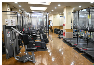
(トレーニングルーム)