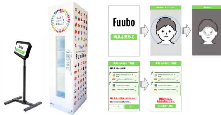
フードロス削減ボックス fuubo