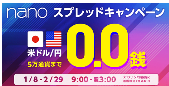
nano米ドル/円 9:00-翌3:00 5万通貨までスプレッド0.0銭キャンペーン