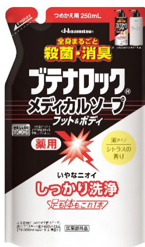
ブテナロック®メディカルソープ フット&ボディ つめかえ用