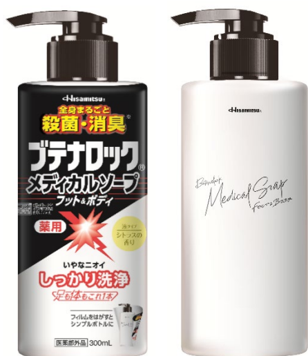
ブテナロック®メディカルソープ フット&ボディ

久光製薬株式会社(本社:佐賀県鳥栖市、代表取締役社長:中富一榮、以下「当社」)は、「ブテナロック®メディカルソープ フット&ボディ」、「ブテナロック®メディカルソープ フット&ボディ つめかえ用」を本日新発売(メーカー出荷)いたしました。