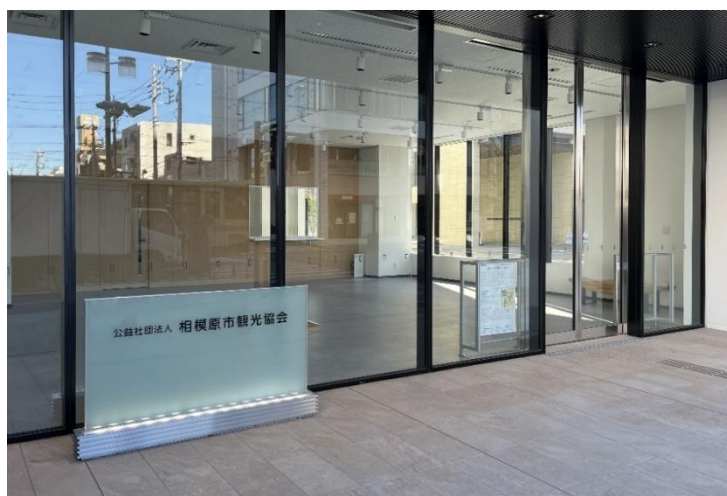
相模原市観光協会および共同利用スペース入口

※2 「CASBEE ウェルネスオフィス」とは、建物利用者の健康性・快適性の維持・増進を支援する建物の仕様、性能、取組みを評価するツールです。ランクは上位から S、A、B + 、B - 、C の 5 段階で表されます。