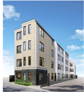
▲EL FARO 用賀外観

所在地 : 東京都世田谷区用賀 2-30-17 (旧建物の住居表示) 交通 : 田園都市線「用賀」駅徒歩4分 延床面積 : 708.33 m 2 階数 : 4階建 総戸数 : 22戸 (1K/11戸、1LDK/3戸、2DK/4戸、2LDK/4戸) 管理会社 : 株式会社前田 竣工予定日 : 2024年4月25日 入居開始日 : 2024年4月26日