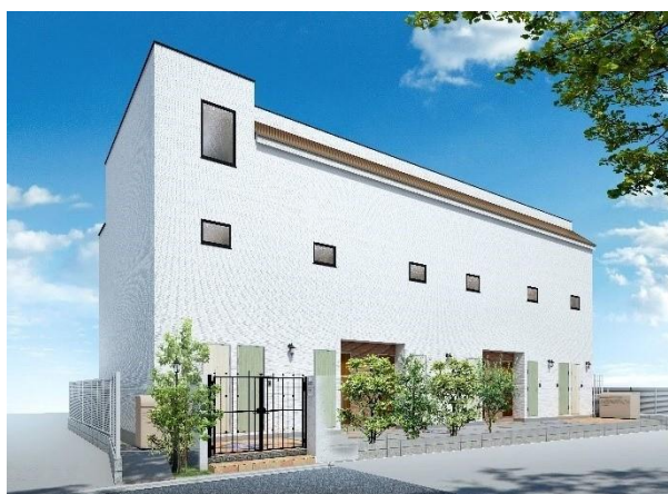
※ 「MIJAS (ミハス)」シリーズ