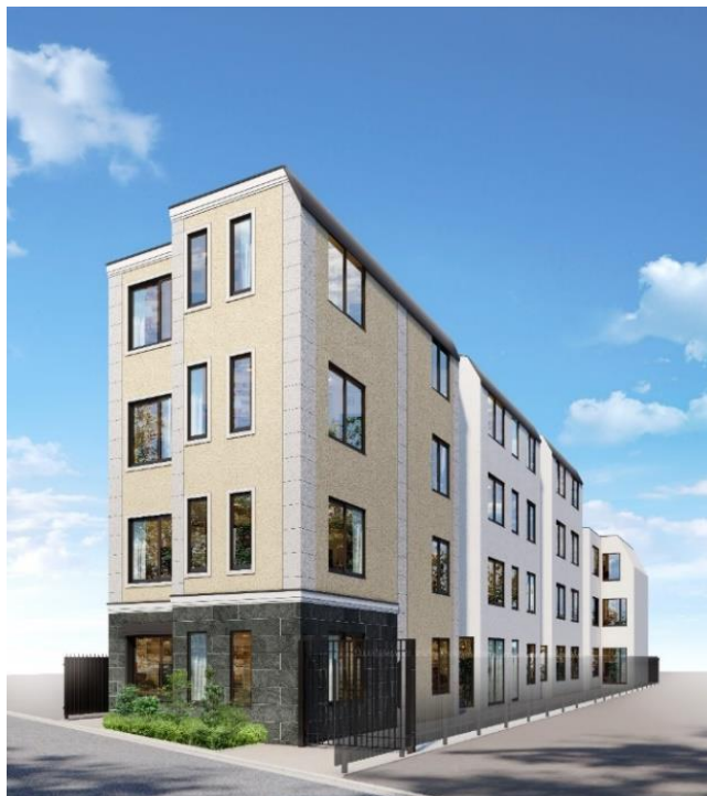
4月25日竣工予定の「EL FARO 用賀」