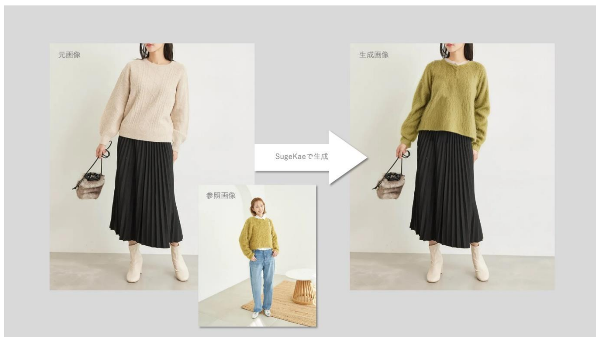
（ジュンの商品画像による SugeKae 使用イメージ）