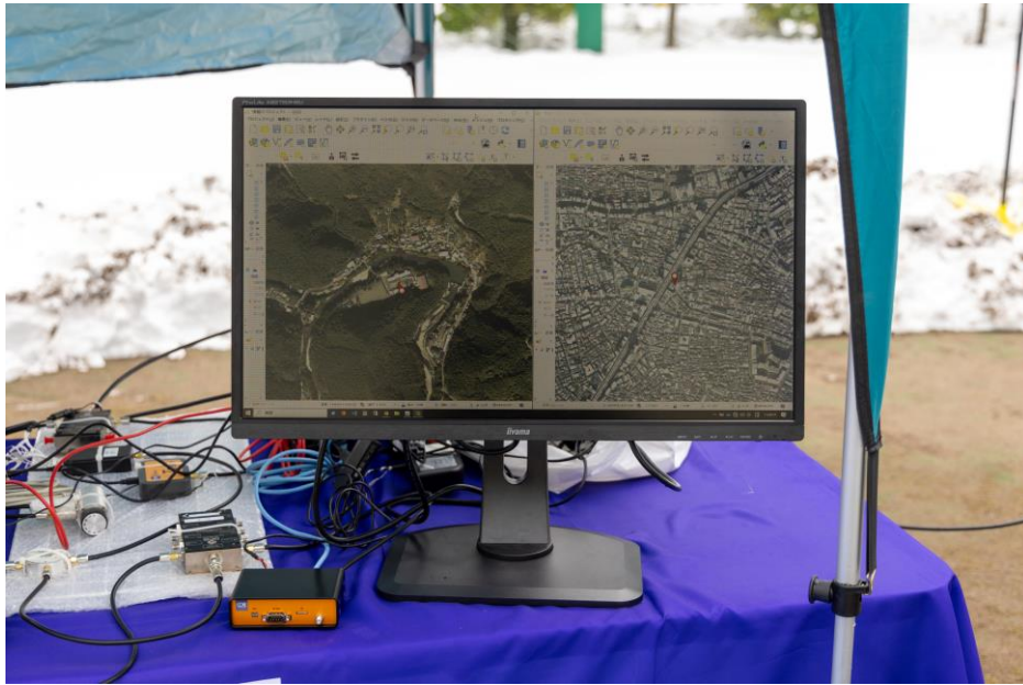
GNSS スプーフィング有線実証実験の様子

※屋外で GNSS の妨害信号を放射することは電波法に抵触するため、当日の実証実験では妨害信号は放射せず、疑似的にスプーフィングを受けた環境を構築してドローンを航行しました。実際の妨害信号による動作については、実証実験の当日デモにて有線により受信機にスプーフィング信号を送信したうえで、正しくスプーフィングの検知・遮断を行い、正常な衛星信号のみを用いて測位ができることを確認しています。