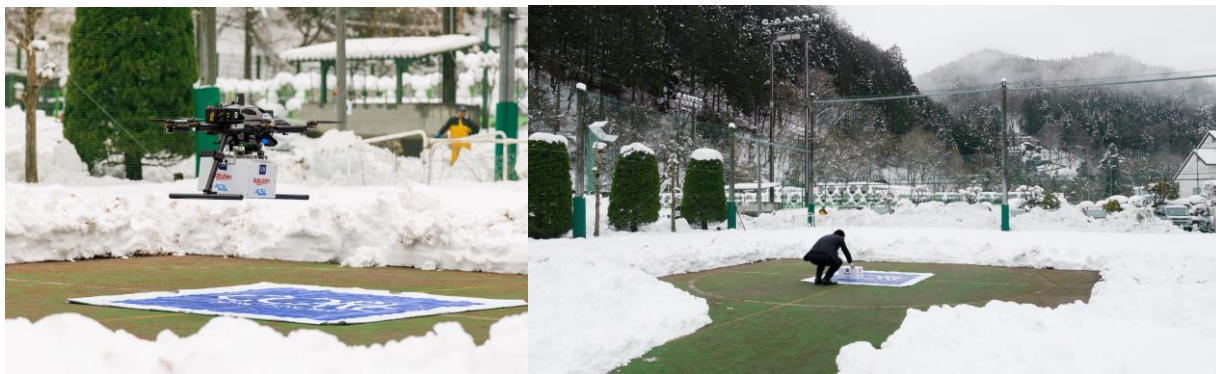
荷物を受け取る様子