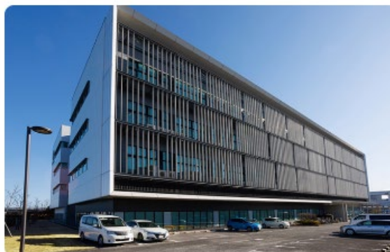
自社で保有する保管施設

当社は再生医療等に用いられる細胞や血液の加工、脂肪組織の凍結保管の受託事業を行っています。数万件の受託実績にもとづいた厳格な管理体制で、お預かりした凍結卵子を安全に保管します。また、当社の自社保管施設で管理し、長期間のサービス提供を問題なく継続できる体制を整えています。