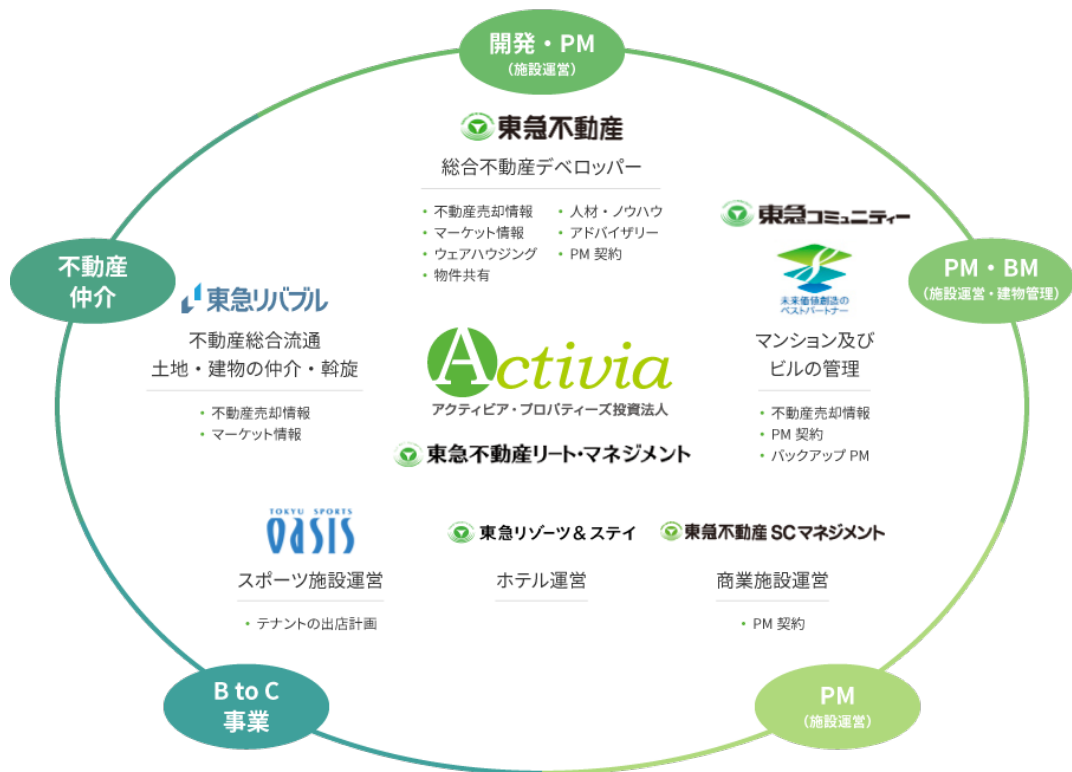
<東急不動産ホールディングスグループのバリューチェーン概念図>