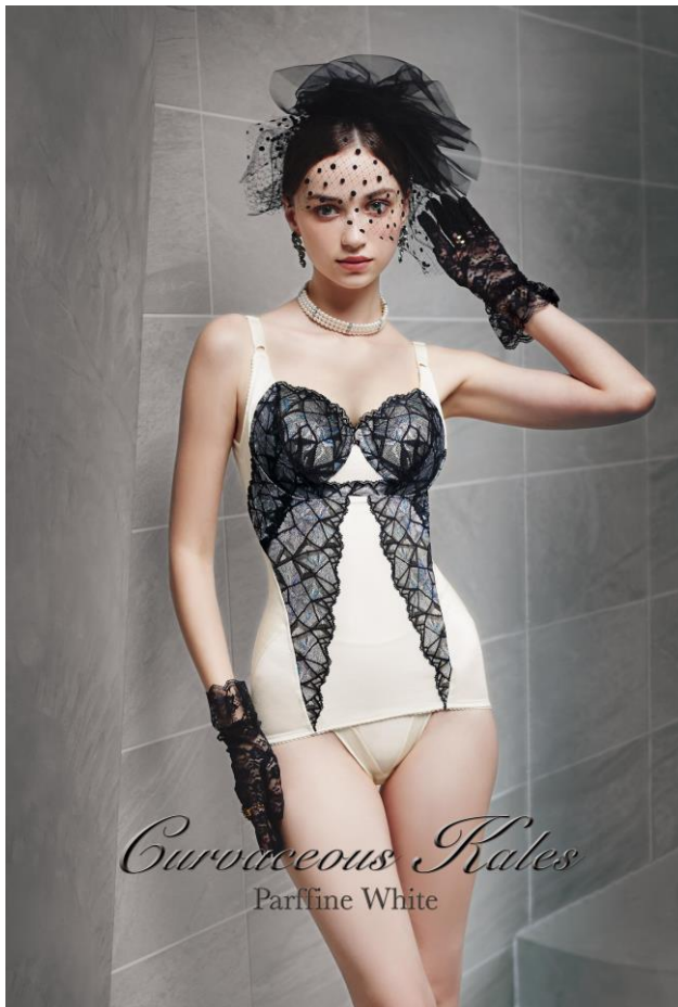
Curvaceous Kales Parffine White

真つすぐと続くランウェイは努力を積み重ね「美」を 手に入れたあなたが歩く道です。 その道を颯爽とを歩く姿は皆のあこがれの的。 高揚と優越を今こそ感じてください。 パルフィネホワイトを纏うあなたは唯一無二の色を はなち、多くの人を魅了し輝き続けるでしょう。