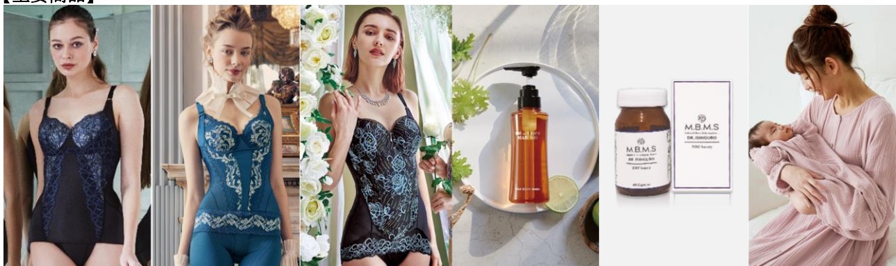
カーヴィシヤス シリーズ