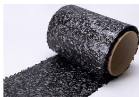
チョップドシート

熱可塑性樹脂をマトリックスに使用した開織薄層プリプレグは、お客様の要望に応じて樹脂の種類、炭素繊維のグレードと量を変えることができ、軽量で高強度・高剛性な成形品を製造することができます。