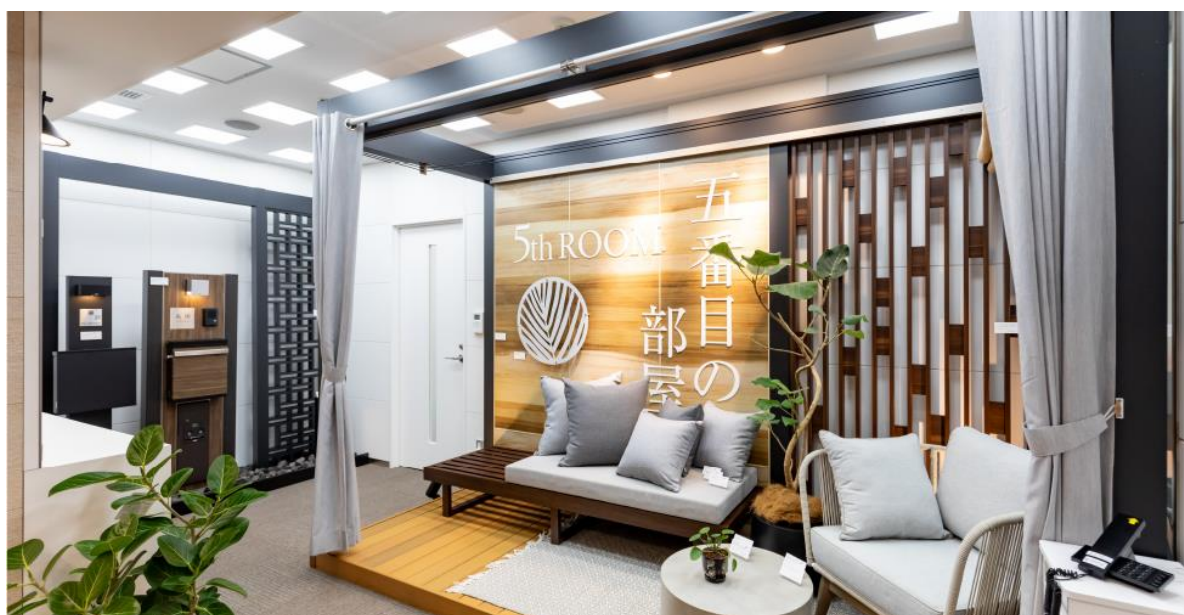
【横浜ショールーム イメージ】

ガーデンライフスタイルメーカーである株式会社タカショー（本社：和歌山県海南市 代表取締役社長：高岡伸夫 東証スタンダード：7590）は、2024年2月1日（木）に横浜営業所／横浜ショールームを横浜市都筑区にある商業施設「プレミアヨコハマ」内に移転いたしました。