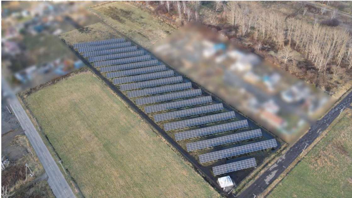
（画像：北海道 札幌市中区中沼町太陽光発電所）

MIRARTH ホールディングスグループと大阪ガス株式会社は、2022年3月に「太陽光発電事業の共同開発に関する覚書」を締結し継続的な協業に合意しております。これまで既に「レーベンエナジー1号合同会社」及び「レーベンエナジー2号合同会社」への出資参画を通じ、中小型太陽光発電所の共同保有を行っております（合計発電容量約5万8,800kW）。今回の契約締結も両者の協業の一環として行われたものとなります。