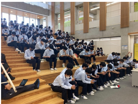
過去に開催した出前授業の様子①