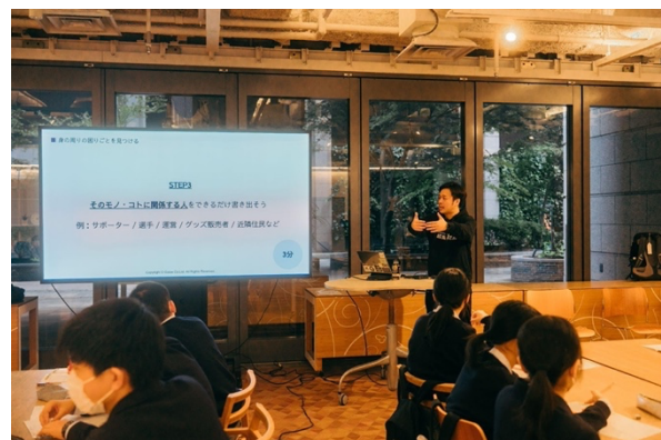
過去に開催した出前授業の様子②