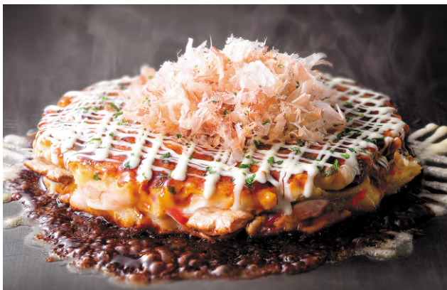
自慢のミックス焼き