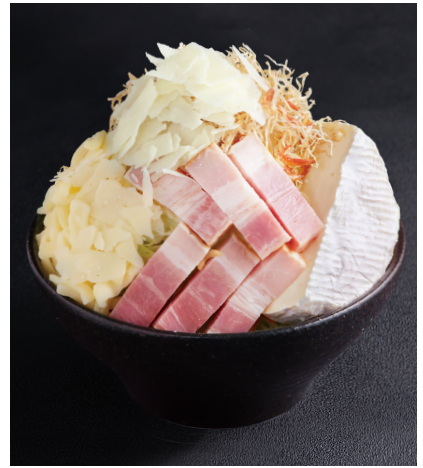
3種チーズのクリームもんじゃ