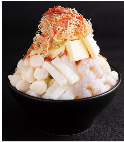
海鮮塩バターもんじゃ