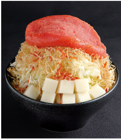
自家製明太子もちもんじゃ