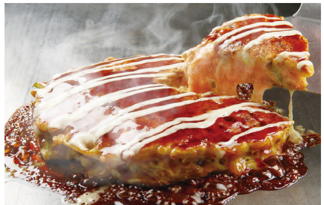
チーズの明太ミルフィーユ焼き