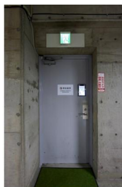
地下駐車場出入口