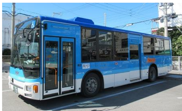
【東運輸が運行する路線バス】