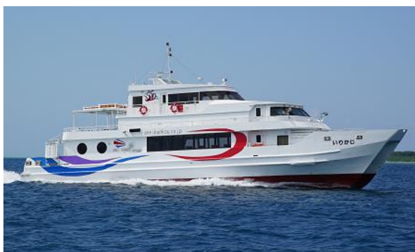
【安栄観光が運航する船舶】