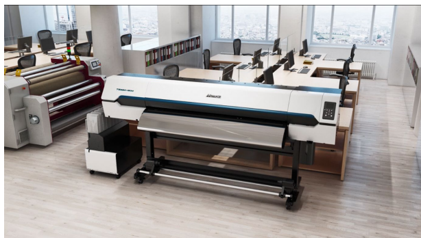
図 3 オフィス環境での導入イメージ

また、捺染がプリントと転写で完了する簡単な工程であり、染色の専門技術と知識が無くとも簡単にオペレーションを始められます。