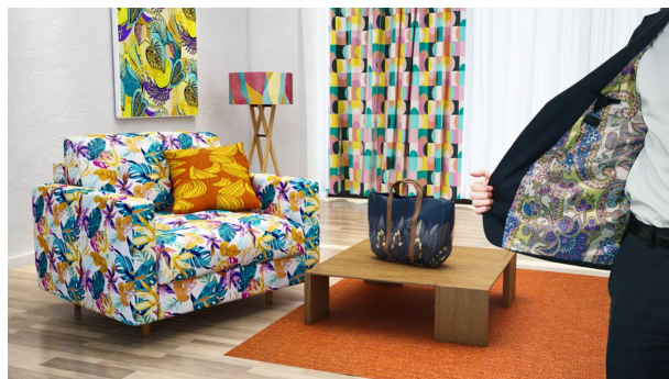
図 4 様々な生地へプリントが可能（イメージ）

さらに、従来の捺染では、繊維の種類ごとに異なる染料（インク種）及び捺染設備が必要でした。しかし TRAPIS は 1 種類のインクで幅広い種類の生地にプリントができます（図 4）。よって、捺染を専門とする染色工場に限らず、様々な場所で様々な生地に、必要な時に必要な分だけ、小回りの利いた染色事業が可能となり、世界的にサステナブル化が求められる染色業界の照準に適合します。