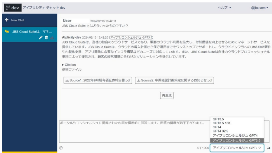
ユーザーインターフェイス

本サービスは、2023 年 4 月に JBS がリリースした、機密情報の漏洩リスクを回避して安心安全に AI チャットを利用できるサービス「 アイプリシティ チャット Powered by ChatGPT（以下、アイプリシティ チャット） 」のオプションサービスとなり、ブラウザベースのアイプリシティ チャットを介してプロンプト入力～回答生成までを行います。