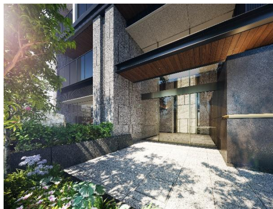
▲ザ・パークハウス 芝御成門 エントランス完成予想 CG