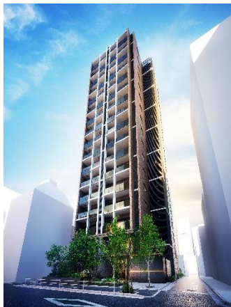
▲ザ・パークハウス 芝御成門 外観完成予想 CG