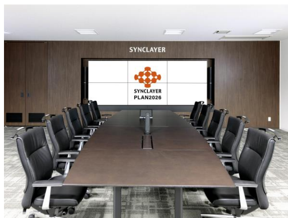
デモンストレーションルーム