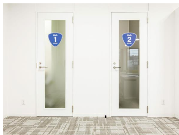
リモート会議用個室ブース