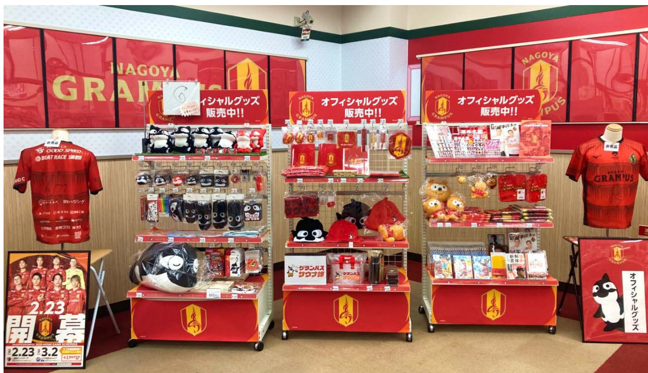
【名古屋グランパスグッズコーナー in 三洋堂書店新開橋店】

株式会社三洋堂ホールディングスの子会社である株式会社三洋堂書店(本社:名古屋市瑞穂区、代表取締役社長:加藤和裕、以下、「三洋堂書店」)では、2月23日より、名古屋グランパスオフィシャルグッズ販売を、三洋堂書店新開橋店・三洋堂書店梅坪店・三洋堂書店香久山店の3店舗にて開始いたしました。