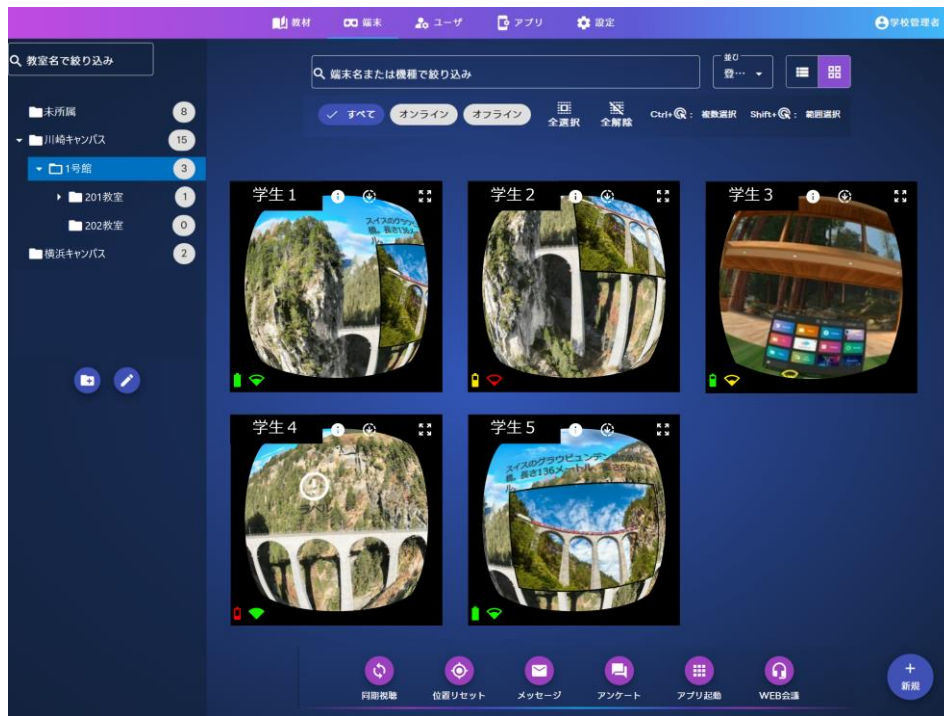
教員PCの画面イメージ（画面一覧）