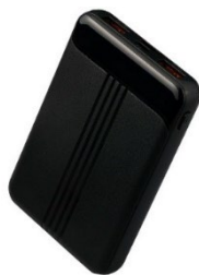
5,000mAh コンパクト モバイルバッテリー

今回販売を開始した新シリーズのモバイルバッテリーは、PD*に対応し、超高速充電が可能になりました。超軽量のコンパクトタイプから高容量かつ薄型のタイプ、バッテリー残量が確認できるディスプレイ搭載タイプまで、多様な製品展開で幅広い需要に応えると共に、同時に3台の充電が可能となっています。さらに、大きな容量の給電が必要なノートPCやタブレットの充電も可能な大容量コンパクトタイプも新シリーズとして発売します。こちらのタイプは同時に4台の充電が可能となっています。当該製品はビックカメラやエディオンなどの家電量販店で購入することができます。