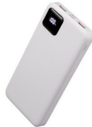
10,000mAh 7セグディスプレイ搭載 モバイルバッテリー