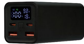
20,000mAh 大容量コンパクト モバイルバッテリー

「 トゥナ Tuna」ブランドは「ヒトやモノ、コトを感動でつなぐ」をコンセプトに、上記のようなモバイルバッテリーのほか、スタンド付き充電ケーブルやミラー付きのリングライトなど「ありそうでなかった」を実現したユニークな製品を販売しています。