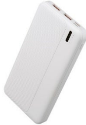
10,000mAh 薄型 モバイルバッテリー