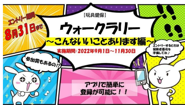
▲ウォーキングに関する啓蒙資料