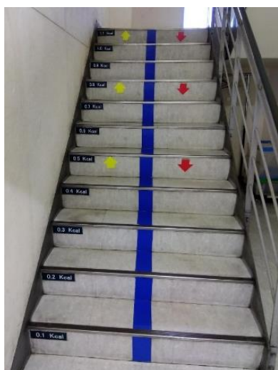
▲階段1段ごとにカロリーを表示

グループでの取り組みに加えて、階段へのカロリー表示や食堂などの環境整備など、社員の健康を維持するための取り組みを実施しています。