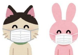
▲社内イントラネットで配信するニュース