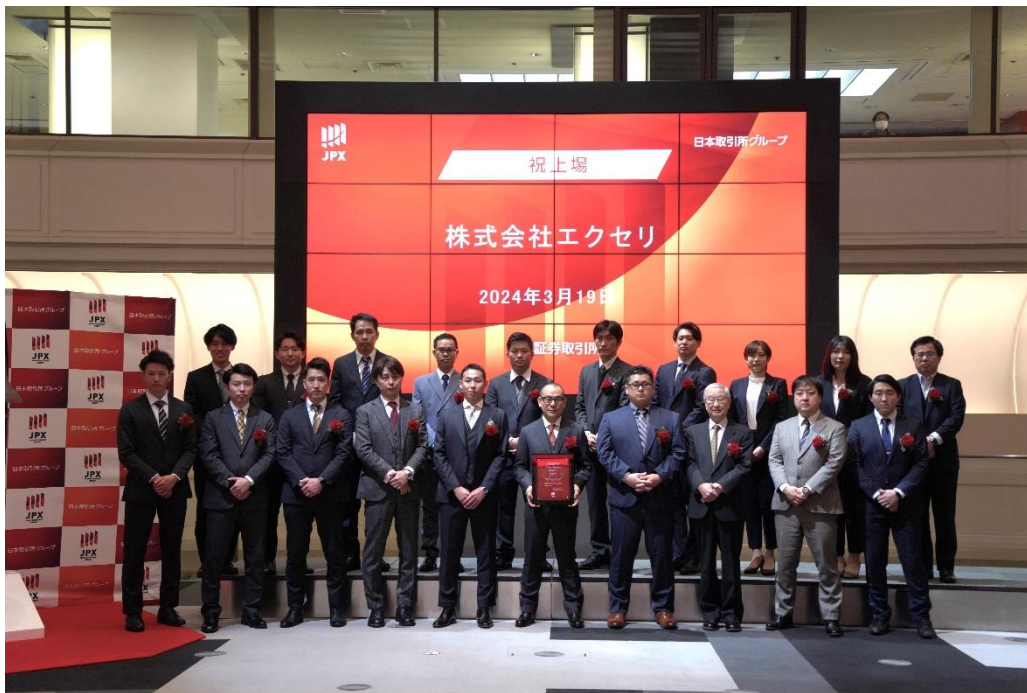
東京証券取引所で開催された上場セレモニーの様子。会場に五穀豊穡を祈願した美しい鐘の音が鳴り響きました。

当社の連結子会社である株式会社日本 M&A センター(以下、日本 M&A センター)が J-Adviser を担当しております株式会社エクセリが、本日、株式会社東京証券取引所(以下、東京証券取引所)が運営する TOKYO PRO Market へ上場いたしましたことを、下記のとおりお知らせいたします。