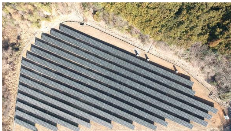
岐阜県美濃市立花

(注1) PPA サービス(Power Purchase Agreement、電力購入契約)。発電事業者が、需要者の敷地内に太陽光発電設備を無償で設置、所有・維持管理した上で、発電された電気を需要者に販売するしくみ。