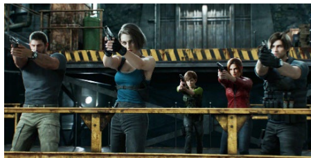
『バイオハザード』シリーズ